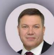
Кувшинников Олег Александрович Губернатор Вологодской области, Председатель Ассоциации «Здоровые города, районы и поселки»