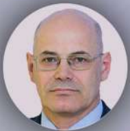
Круглый Владимир Игоревич Член Совета Федерации Федерального Собрания РФ, сопредседатель Форума