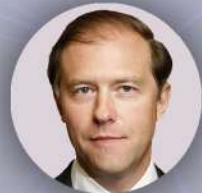
Мантуров Денис Валентинович Министр промышленности и торговли РФ