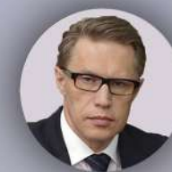
Мурашко Михаил Альбертович Министр здравоохранения РФ