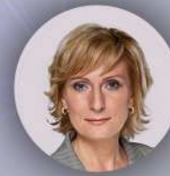
Святенко Инна Юрьевна Председатель комитета Совета Федерации по социальной политике, сопредседатель Форума