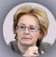
Скворцова Вероника Игоревна Руководитель Федерального медико-биологического агентства России