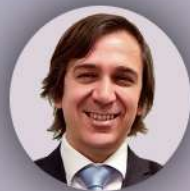
Д-р Жоао Бреда Глава Европейского офиса ВОЗ по профилактике и борьбе с неинфекционными заболеваниями