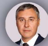
Фальков Валерий Николаевич Министр науки и высшего образования РФ